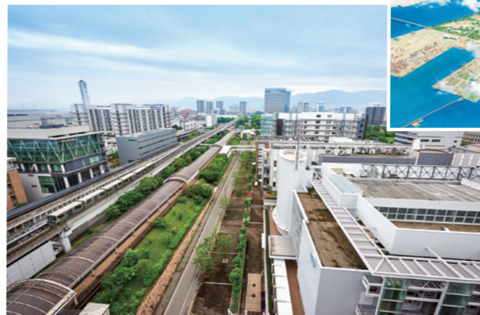
将来ビジョンイメージ

1981年にまちびらきした人工島。三宮や神戸空港とはポートライナー一本で結ばれており、陸・海・空の交通アクセスに優れたビジネス拠点として人気です。また、神戸医療産業都市の中核地として、近年は医療関連企業や研究機関の集積が急速に進んでいます。現在、ポートアイランドの活性化に向けて、将来ビジョンの検討や公共施設・公共空間の再整備等に取り組んでいます。