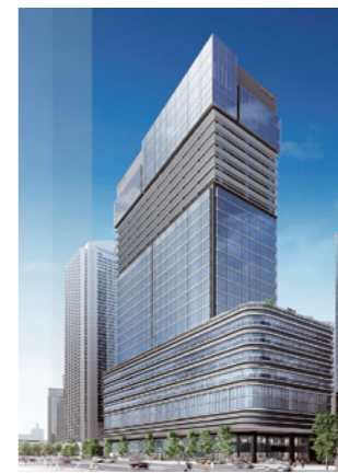
市役所本庁舎2号館 2028年度ごろ完成予定

都心の再生に向けて、庁舎の再整備が進んでいます。2022年7月に中央区役所・中央区文化センターが完成したほか、本庁舎2号館の建て替えも進みます。