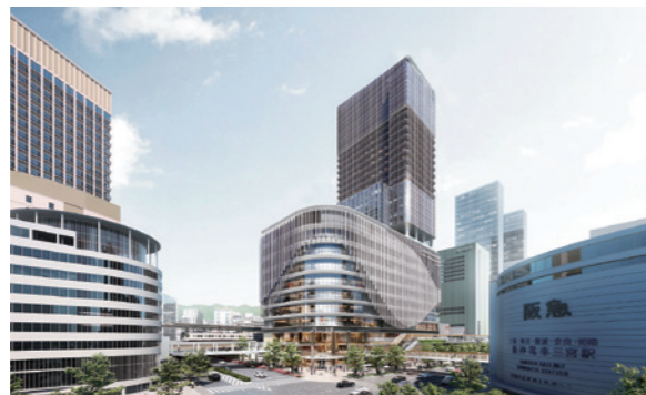
JR三ノ宮新駅ビル | 2029年度開業予定