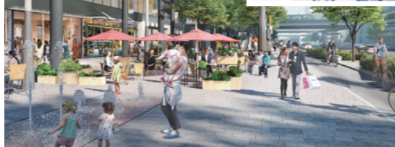
三宮クロススクエア(東側・第1段階)