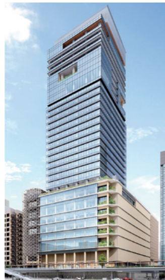
新バスターミナル(1期)ビル 2027年12月工事完了予定