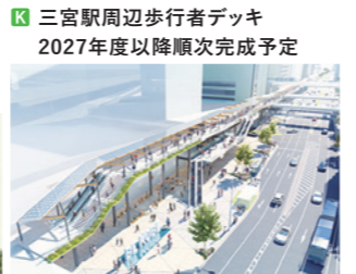
三宮駅周辺歩行者デッキ 2027年度以降順次完成予定