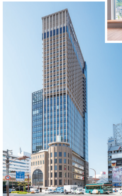
神戸三宮阪急ビル 2021年4月開業

神戸三宮阪急ビルが2021年4月に開業し、JR三ノ宮新駅ビルの構想も発表、西日本最大級のバスターミナルも整備されます。