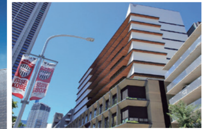
中央区役所・中央区文化センター 2022年7月供用開始