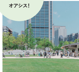
東遊園地 | 2023年4月北側園地・にぎわい拠点施設完成