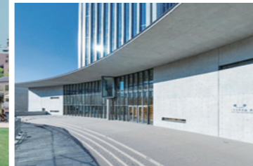
こども本の森 神戸 | 2022年3月開館 ©安藤忠雄建築研究所